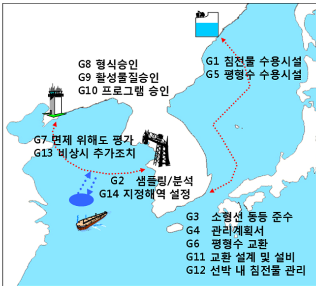
Fig. 1. IMO Guidelines for Ballast Water Conventions.

시운전을 개발자가 임의로 할 수 없고 G10 처리장치 프로그램 승인 지침서에 따라 해당 정부로부터 실선시운전 프로그램 승인을 받은 후 진행하여야 한다. 협약 이행시 각국 항만 당국에서는 입항 선박이 배출하는 선박평형수가 협약의 성능기준에 맞게 배출되는 것을 확인하기 위해 G2 샘플링 지침서(IMO[2008b])에 따라 선박평형수 샘플을 채취하고 생물시험을 수행하게 된다.